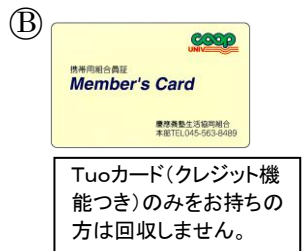
Tuoカード（クレジット機能つき）のみをお持ちの方は回収しません。

※振込先口座（銀行名・支店番号3ケタ・預金の種類・口座番号・名義人）について明記してください。口座名義がご本人または親族の方の口座に限ります。（ゆうちょ銀行の場合は他銀行からの振込口座をご記入ください。）